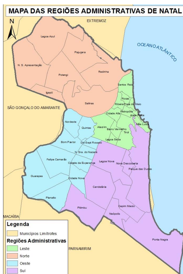
Figura 1. Mapa das Regiões Administrativas de Natal

O território municipal é dividido em 36 bairros, agrupados em quatro regiões ou zonas administrativas, conforme apresentado nas Figuras a seguir.